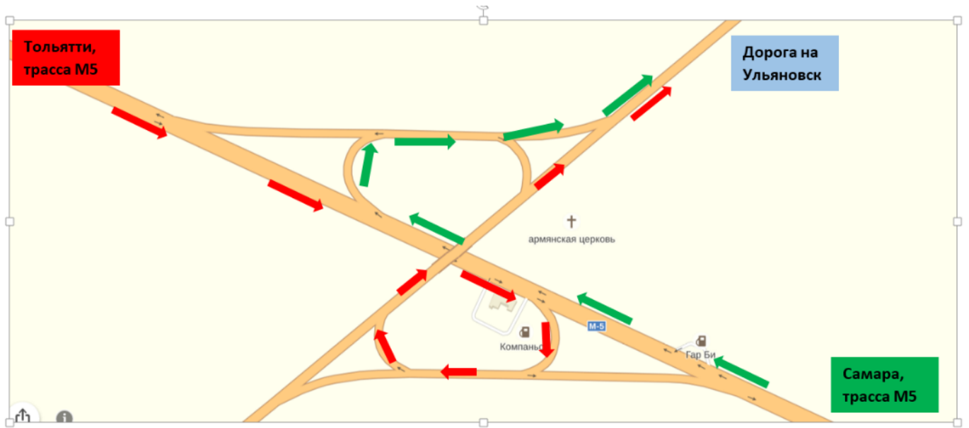
Рис 2 Первая развязка на Ульяновской дороге (поселок Светлое поле)